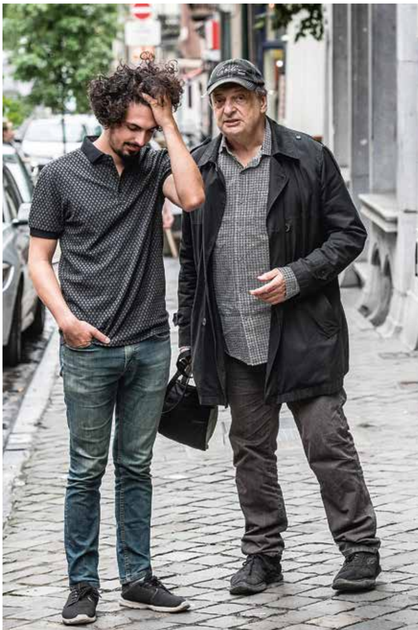
'Leeftijd betekent niets voor mij. Het klinkt goed of niet.' – PHILIP CATHERINE

Transparence . Het was de periode van Gorbatsjov zijn politiek voor meer openheid onder de noemer glasnost. Sommigen dachten dat ik een politiek statement maakte met die titel. Het was echter een verwijzing naar de doorzichtigheid in de muziek. Net zoals je een schilderij in 3D zou bekijken.